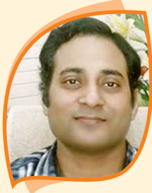
Dr. Arvind Krishna